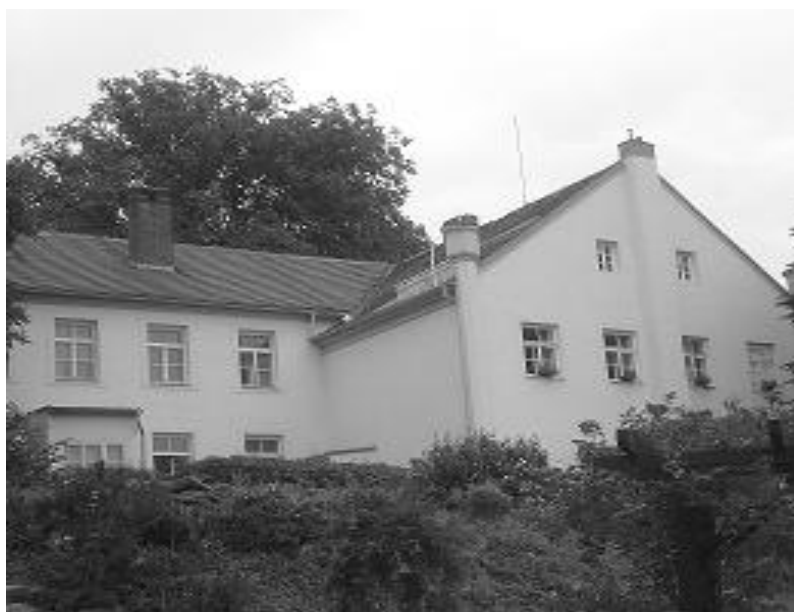
Tady jsme bydleli.