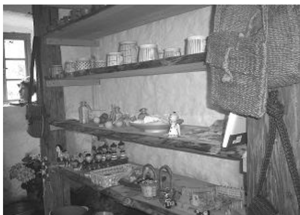
Galerie lidových řemesel Ungelt