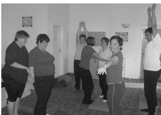
... škoda, že ne v posteli ...