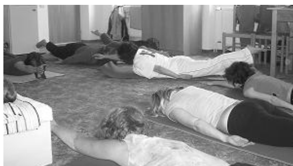
... ale vleže je to taky fajn.