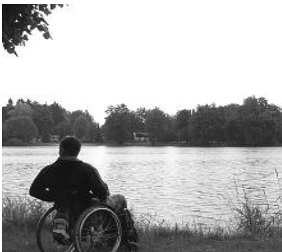
Tam bude ryb ...