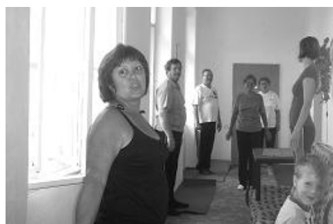
Cvičíme, cvičíme ...