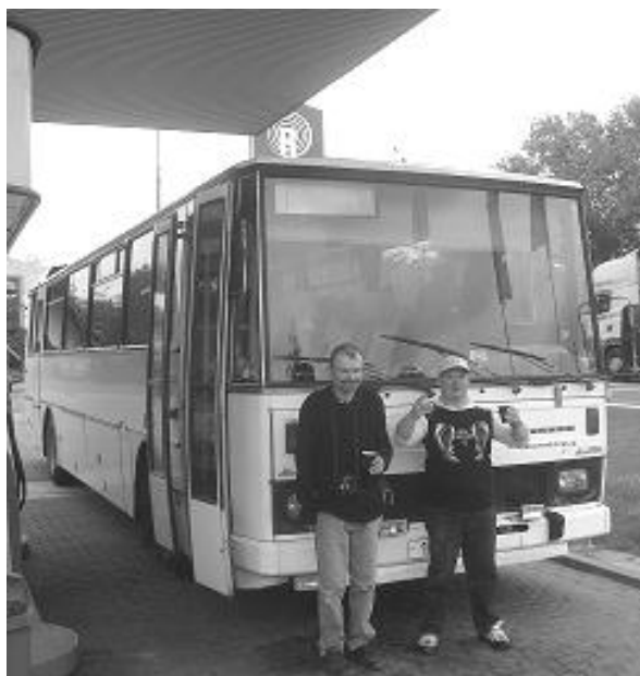
Bez odpočinku to nejde...