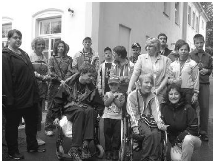
První výlet po okolí.