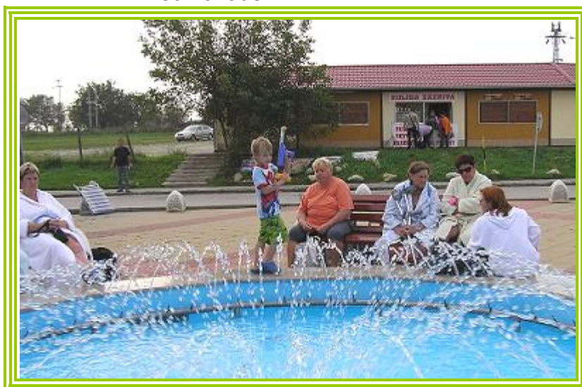
a už jsme uvnitř :-)