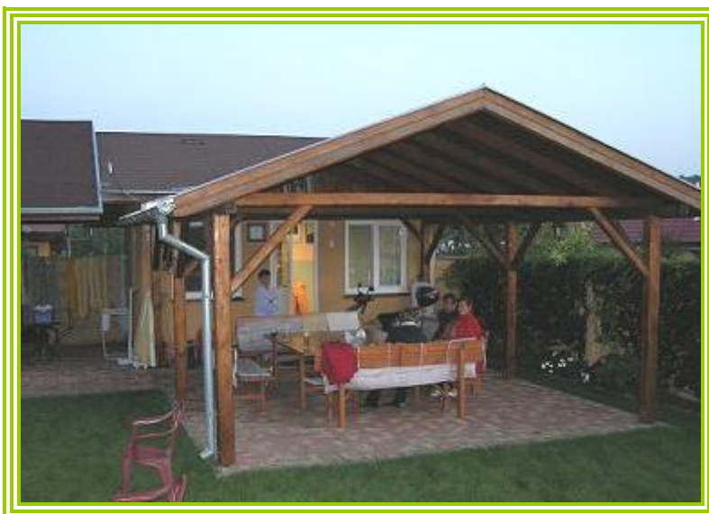
...a pohled zezadu ...