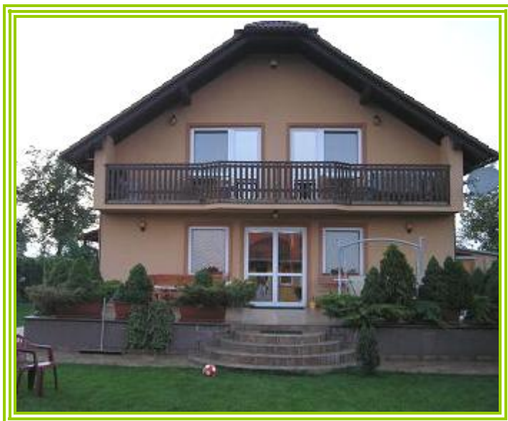
Tady jsme bydleli...