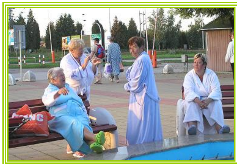
Tak tomu se říká pohoda....